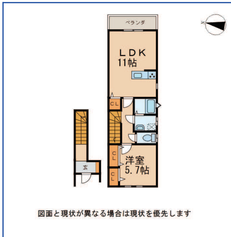
図面と現状が異なる場合は現状を優先します